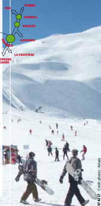
Conception : HESQUARTT - 04 50 57 42 37